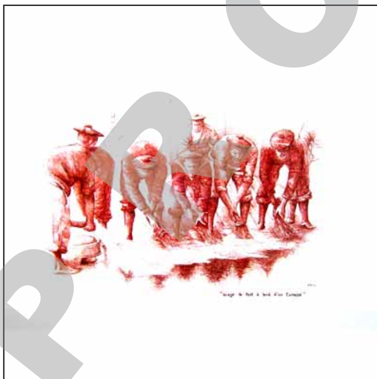
Lavage du pont