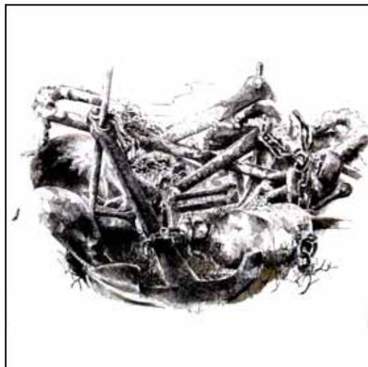
Parc aux chaînes