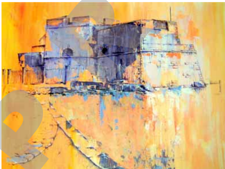
Fort St Louis