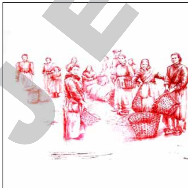
Moisson de la mer